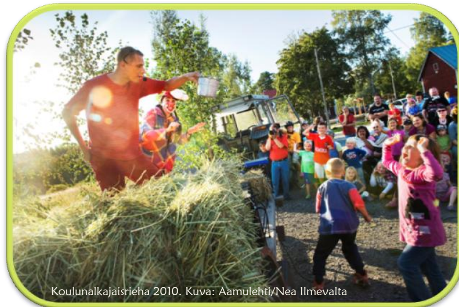
Koulunalkajaisrieha 2010.

Pirkkalasta Lempäälään johtava muinaistie on kulkenut alueen kautta ja tielinja on vielä havaittavissa paikka paikoin. Kiinteä asutus on levinnyt Pirkkankylältä Sikojokea pitkin Sikojärven ympäristöön ja asukkaita on muinaistietä myöten tullut myös idän suunnasta. Alueella on siis poikkeuksellisen pitkä asutushistoria.